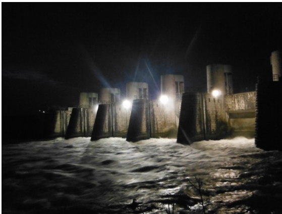
照明は点検用のライトです。暗闇に浮かび上がる姿はまさに守り神。思わず「すごい！」の声。