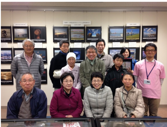
参加者の皆さんと記念撮影！寒い中、暗い中、ご参加いただいたことに感謝です。