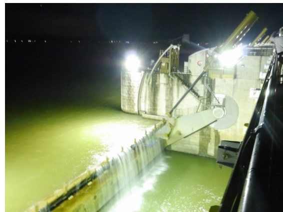
可動堰はメカニカルな雰囲気がまたいい！「こっちもいいね！」と感想をいただきました。