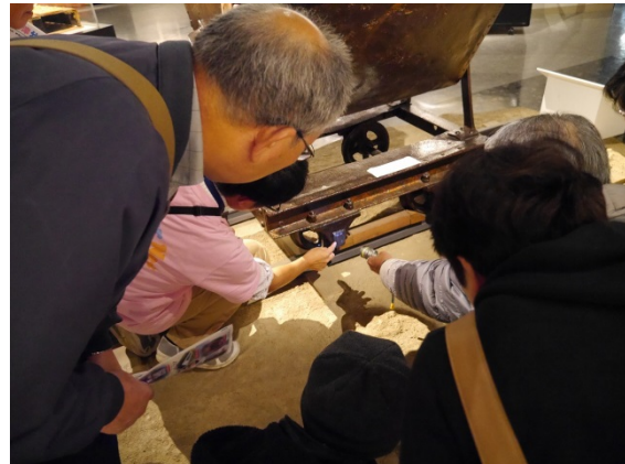
大河津資料館の銅ト口。指さしているところに何かが記されています

おもな内容 期日：平成27年10月31日（土） 行程：15:30 大河津資料館 16:40 堰の操作室 17:00 新洗堰 18:00 新可動堰 参加者：11名