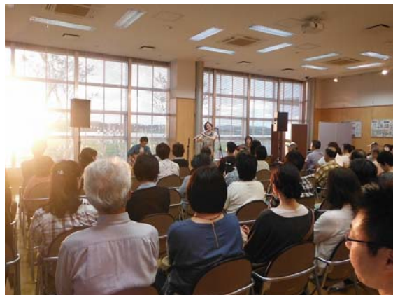
ブラインドを開けると「わああ！」という歓声が。夕陽が映える大河津分水がバックステージに早変わり。