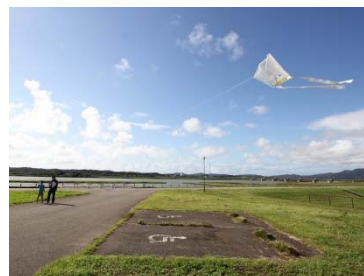
大河津分水に凧が舞いました！