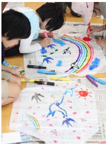
凧には絵柄も書き入れました