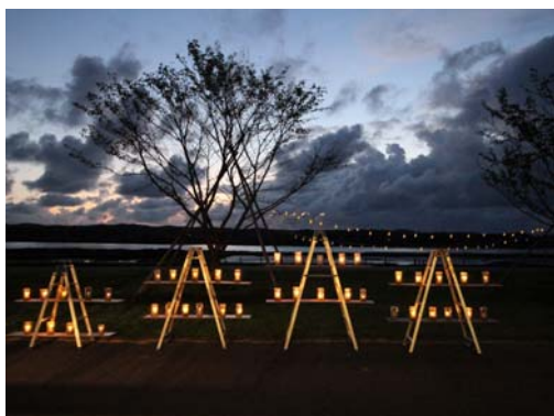
登録有形文化財の洗堰はキャンドルロードに！手作りペットボトルランタンで暖かく輝くのは「つばめキャンドル」さんのキャンドルです！