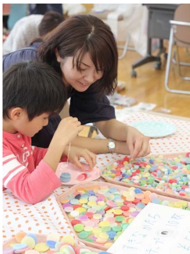
結婚式のキャンドルを再利用