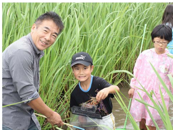
お父さんの腕の見せどころ！