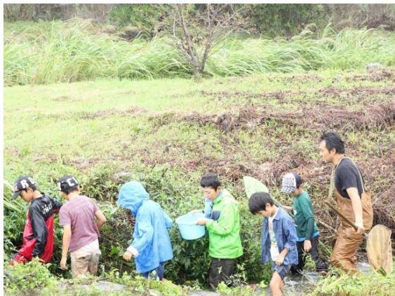
たくさんの生き物にテンションUP！